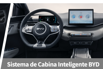
Sistema de Cabina Inteligente BYD