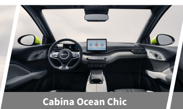
Cabina Ocean Chic