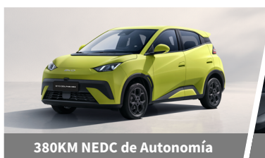
380KM NEDC de Autonomía