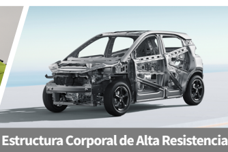
Estructura Corporal de Alta Resistencia