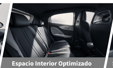
Espacio Interior Optimizado