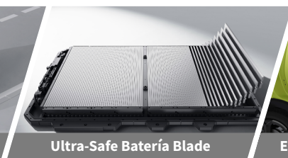
Ultra-Safe Batería Blade