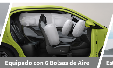
Equipado con 6 Bolsas de Aire