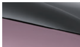
Coral pink + Urban grey