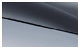
Skiing white + Urban grey