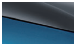
Surfing blue + Urban grey