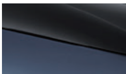
Atlantis grey + Jet black