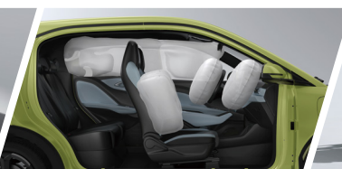
Equipado con 6 Bolsas de Aire