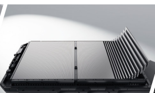
Ultra-Safe Batería Blade