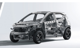
Estructura Corporal de Alta Resistencia