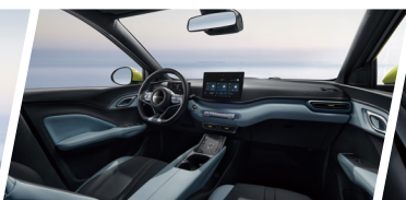
Cabina Ocean Chic