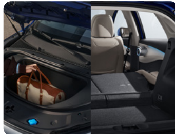
Geräumig und beheizbare Sitze