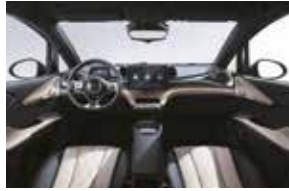
Noir / Beige Cappuccino