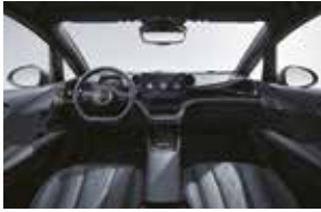
Noir / Gris