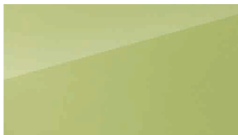
Zelena Lime Green