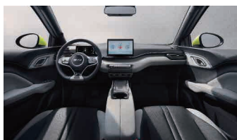
Črna in siva