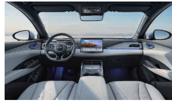
Črna in siva