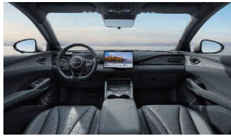
Modra in črna