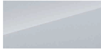
Bela Polar White